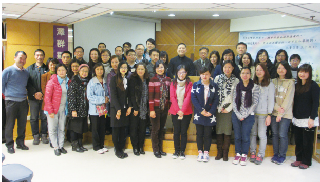
第一屆「職場宣教面面觀」